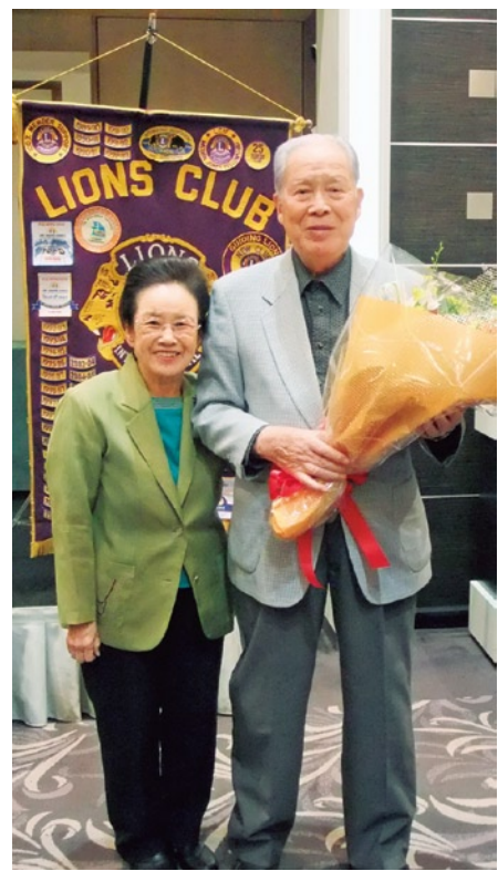
チャーターメンバーのL藤本に花束贈呈

奇しくもこの日は「ボジョレーヌーボー解禁日」。L長野のスピーチを聞いて酒屋に走ったLが多かったのではないのでしょうか？