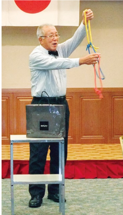
謎のマジシャン登場