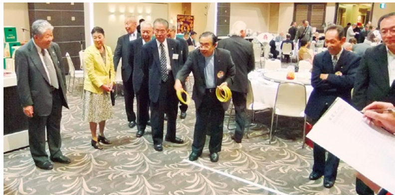
童心にかえって、 輪投げも白熱?!