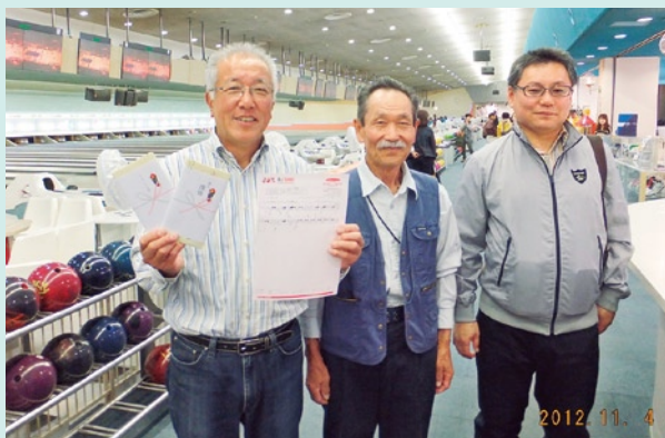
スコアは180と204でした