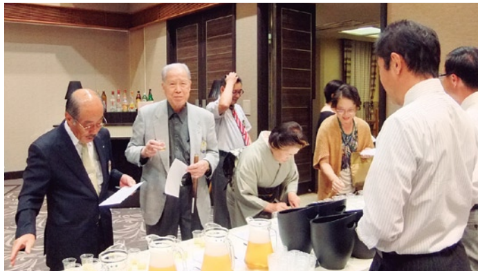
利き酒する目も真剣 です