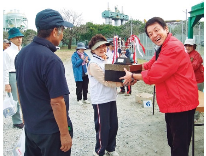
優勝！おめでとうございます