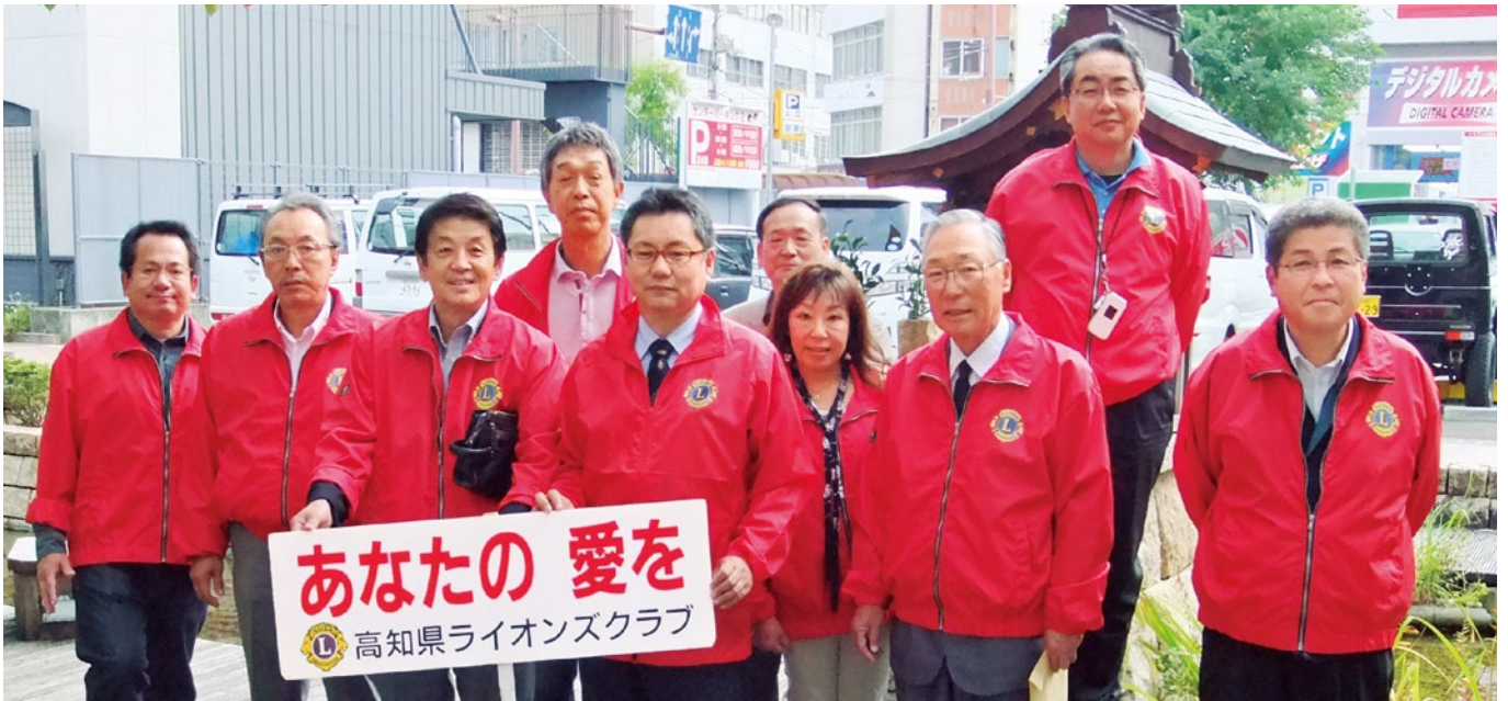
平成24年10月27日(土) 献血・献眼・献腎・骨髄提供推進キャンペーン『あなたの愛を』パレード 高知城丸の内緑地～帯屋町・京橋～大丸前・京町～はりまや橋公園